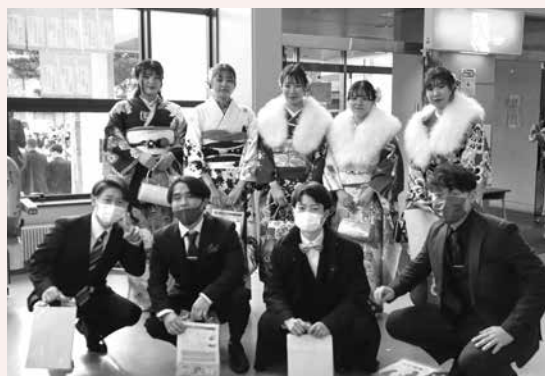
前回の成人式の様子

◆ 申込先・問い合わせ 町生涯学習課社会教育係(☎82-3111内線624)へどうぞ。