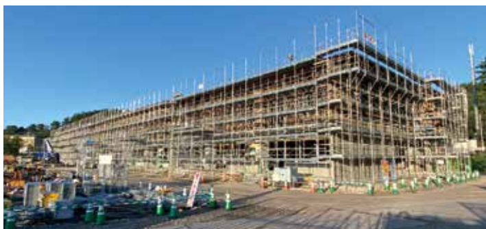
建設途中の山田小学校の外観

新校舎完成後には、机、椅子、家具などの備品や現在の校舎から教材などの搬入を行ったのち、山田小学校は、令和6年8月に新校舎へ移転し、学校活動を開始する予定です。