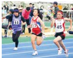
児童たちは記録更新を目指し記録会に挑みました