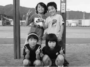
町で出会ったかわいい笑顔