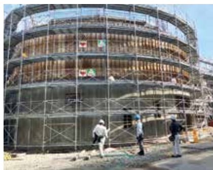
学校図書館部分の外観