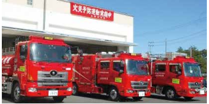
山田消防署では、火災予防運動の取り組みとして、防火チラシの配布や高齢者の単身世帯への訪問などを行っています