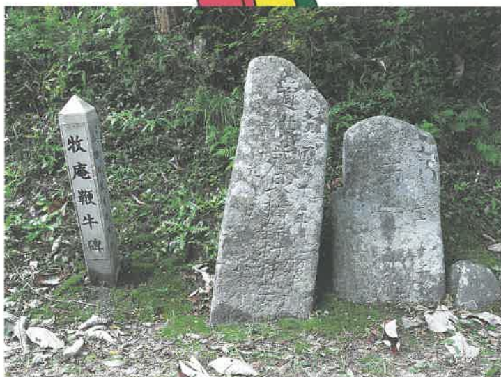
ふなこしやまの うち べんぎゅう び 船越山ノ内の鞭牛碑

船越半島の大綱、荒川の穴乳山洞窟、船越山ノ内、織笠新田、三本小松にも鞭牛さんに関する石碑があります。