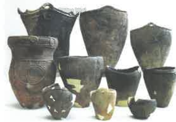
発掘された家のあと(上)と土器