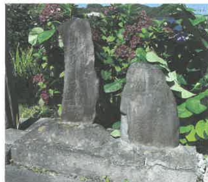
とよまね みち 豊間根の道しるべ(右)