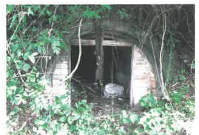
防空壕の跡。今は、危険なため立ち入り禁止になっています。