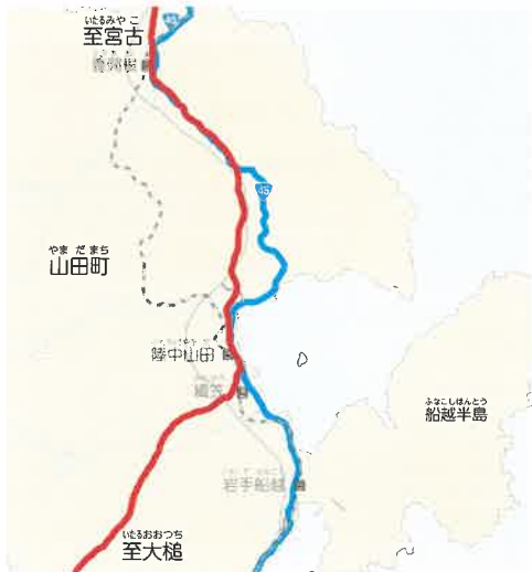
むかしの道(赤)と今の国道45号(青)

の上野碑、船越碑、織笠船越絵入道標(リーフレット⑩「まちをつなぐ・ささえる」の表紙)の4つの道しるべも建てられました。