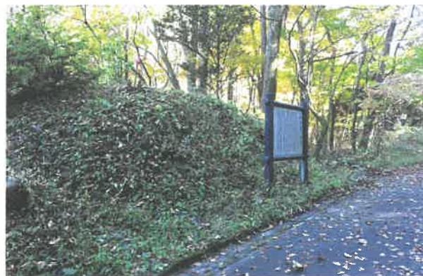
たなぶ いちりづか 田名部の一里塚