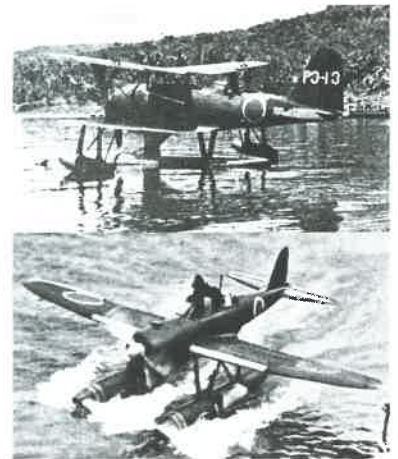
2人乗りの零式観測機(上)と3人乗りの零式水上偵察機(下)。それぞれ4機と6機が山田湾にいました。