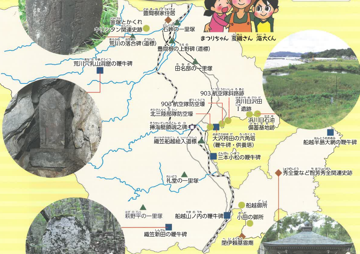
山田の史跡マップ