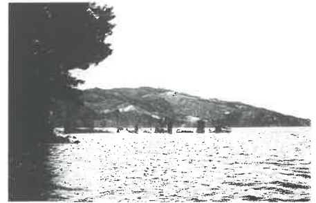
空襲を受けた第一号掃海艇。艦首をオランダ島にむけたまま、沈みかけているところです。