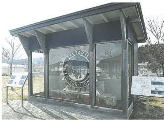
旧JR陸中山田駅の大時計は、津波がおそってきた3時27分を指したまま止まっています。

御蔵山にあるこの時計や、そばに建てられた「津波犠牲者慰霊碑」「消防殉職団員慰霊之碑」は、東日本大震災のときの苦難や津波の恐ろしさを未来に伝えていくための「新しい史跡」だと言えるでしょう。