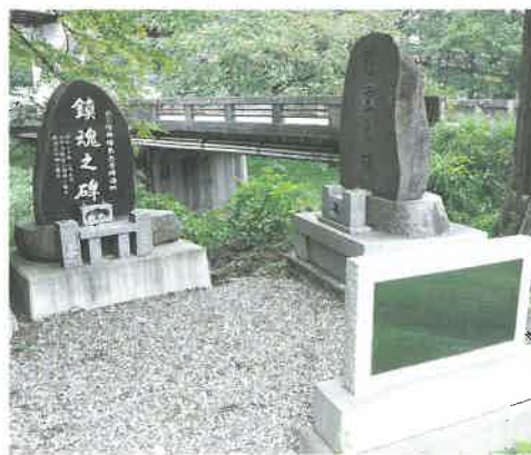
関谷橋のそばにある、北三陸部隊関連の「鎮魂之碑」「慰霊之碑」。ここは、戦死した人を火葬にした場所でもあります。

その3隻も1945(昭和20)年8月9日・10日の山田湾空襲により沈むことになりました。戦争が終わる、5日前のことでした。