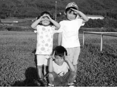
町で出会ったかわいい笑顔