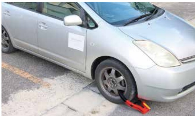
自動車の差し押さえの様子(タイヤロック)

町税が納期限までに納付されなかった場合、下図のとおり督促状を発送し、それでも納付が確認できないときは、滞納処分を行います。 滞納処分には、給与や預貯金などの債権のほか、自動車や貴金属などの動産、家や土地などの不動産の差し押さえがあります。