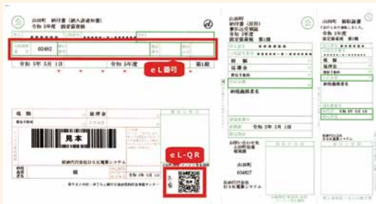
地方税統一QRコードなどが追加された納付書