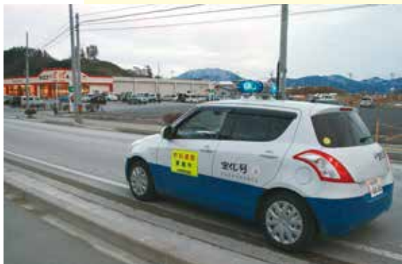
青い回転灯が目じるしの防犯パトロール