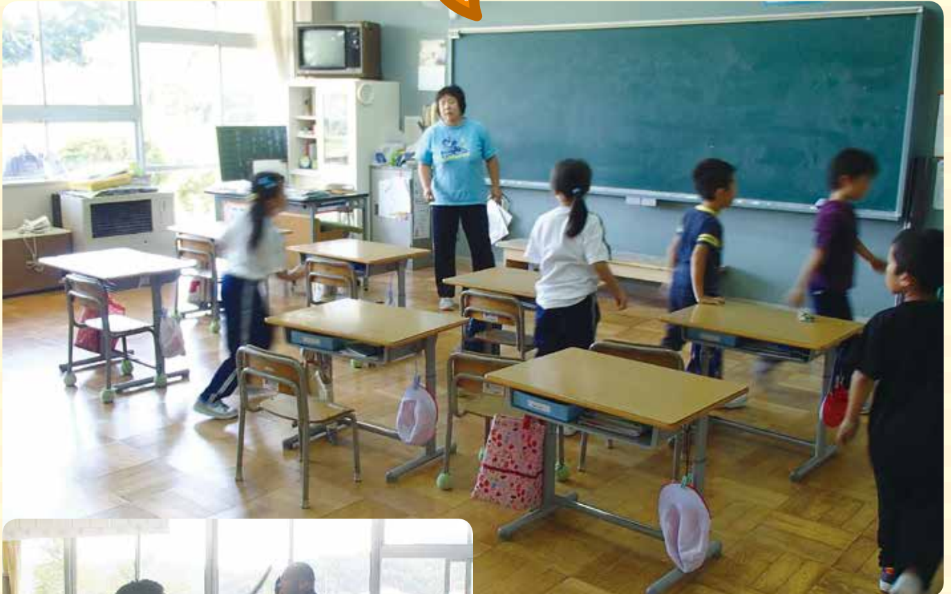
ふしんしゃ そうてい ひなんくんれん あらかわしょうがっこう 不審者を想定した避難訓練(荒川小学校)