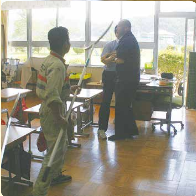
こうない はい 校内に不審者が入ってきた想定 of 訓練です。