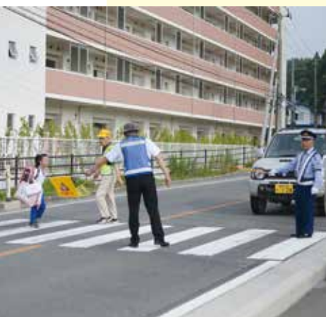
朝の交通誘導・保護活動に立つ交通指導員

交通事故防止のために1968(昭和43)年に作られた山田町交通指導隊は、現在9名の交通指導員で構成されています。