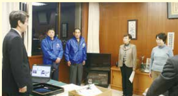
女性隊員2名の辞令交付式の様子 女性の防犯隊員は全国的にもめずらしいです。