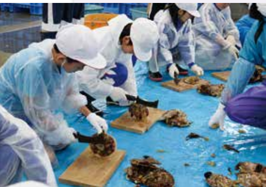
ホタテたたき (大浦小学校)

漁業は町の基幹産業であり、漁業や海と向かいあうことは地域の歴史 や文化にふれるということでもあります。