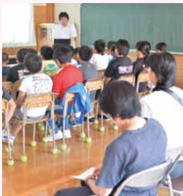
情報モラル・メディアリテラシーについて学ぶ。 (豊間根小学校)

親子や地域の問題について意識や知識を高め、問題の解決につなげるための、親子での学びの場です。