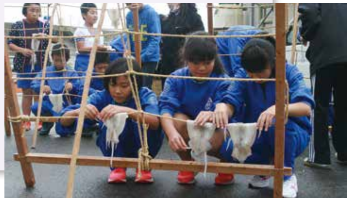
スルメ干し (大沢小学校)