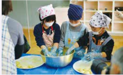
みんなで作ったお米をついて、きなこもちにする。 (荒川小学校)