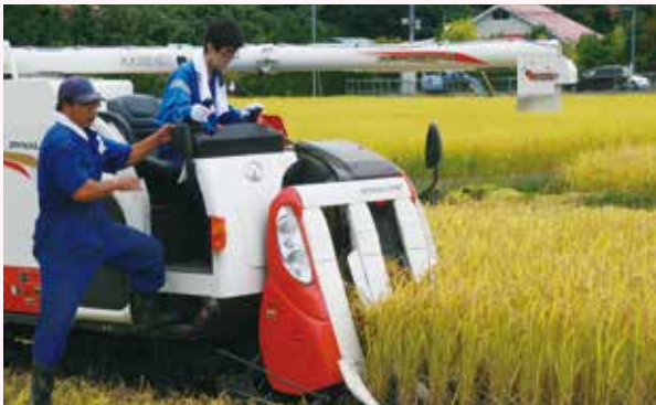
さまざまな「仕事」を体験する。(山田中学校)

子どもたちはいずれ社会に出て、何らかの仕事をもって生活していきます。職場体験はそのための学びです。