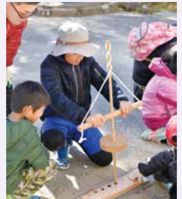
年長者から学んで、火のおこしかたを体験する。(北小おやじの会)