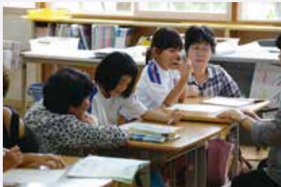
祖父母参観授業でいっしょに考える。(大浦小学校)