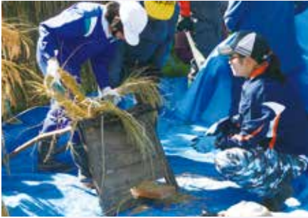
かり取った稲を「お米」に。 (轟木小学校)

自然とともにあり、命を育む食べ物を作り、収穫する農業の大切さを 実感する学びが行われています。