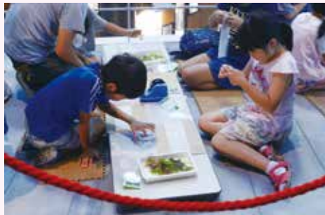
夏休みに開催されたワークショップ

「自然環境としての海」「生命を育む海」「人間とかかわる海」の3つをテーマとする鯨と海の科学館は、単なる展示施設ではなく、さまざまな講演会・学習会・ワークショップなどを開催しています。