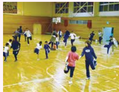
みんなで身体を動かす「親子健康教室」 (山田南小学校)