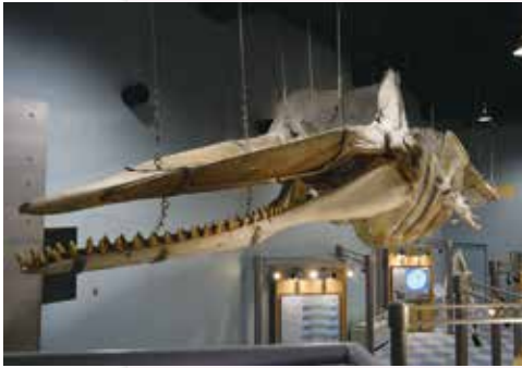
館を象徴する、世界最大級のマッコウクジラ骨格標本

「自然環境としての海」「生命を育む海」「人間とかかわる海」の3つをテーマとする鯨と海の科学館は、単なる展示施設ではなく、さまざまな講演会・学習会・ワークショップなどを開催しています。