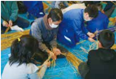
地域のお年寄りに教わって年縄を作る。(轟木小学校)