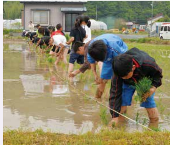
はだしで田に入り、手で苗を植える。 (豊間根小学校)