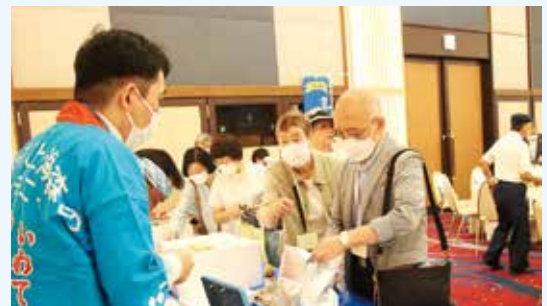
本町特産品の物産販売が行われました

山田弁で語り合えるこの会が楽しくてずっと参加しています。久しぶりに再会した友人と会話していると、山田に住んでいた頃を思い出しました。この会を通じて同郷の皆さんと繋がりを持つことができるのも魅力の一つですね。