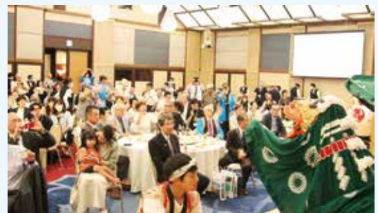
八幡大神楽の演舞に盛り上がりました