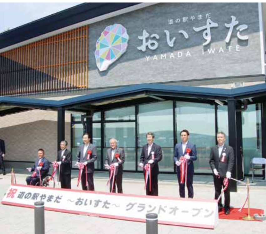
オープニングセレモニーでのテープカットの様子

本町の新たな産業振興の拠点として、柳沢地区の三陸沿岸道路山田IC付近に建設が進められていた道の駅やまだ(愛称・おいすた)が完成し、7月23日にグランドオープンしました。オープン初日には約2500人が訪れ、開業を待ちわびた大勢の買い物客らでにぎわいました。ここでは、開業した道の駅やまだの様子を紹介します。