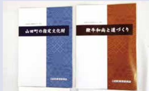
左が第1巻「町の指定文化財」、右が今回販売する第2巻「鞭牛和尚と道づくり」