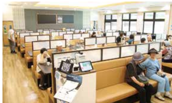
旬な味が楽しめるレストラン