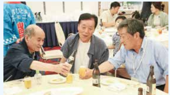
懐かしい思い出話にお酒が進みます

姉妹で参加しました。遠くに住んでいると、ふる里ほどよいものはないと感じます。なかなか帰れません、大好きな山田のお祭りや街並み風景を見ることができてとても懐かしい気持ちになりました。また来年も2人で参加するのが楽しみです。