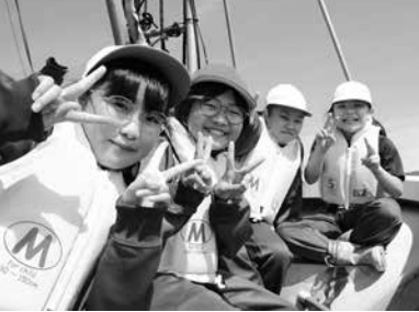
カメラに向かってピース (山田小学校の漁業体験)