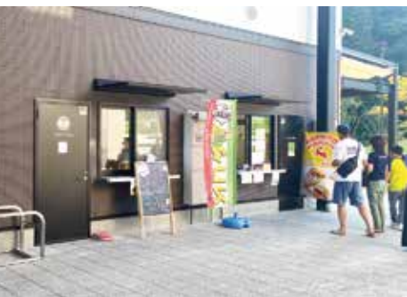
ファストフード店の様子

夫が施されています。営業時間は、月曜から木曜までが午前9時から午後6時まで、金土日曜と祝日は、午前9時から午後8時までです。