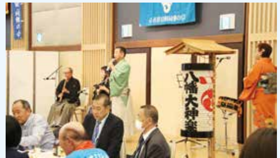
民謡披露で場内は一層和やかに