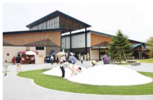
新しい遊具を備える緑地広場