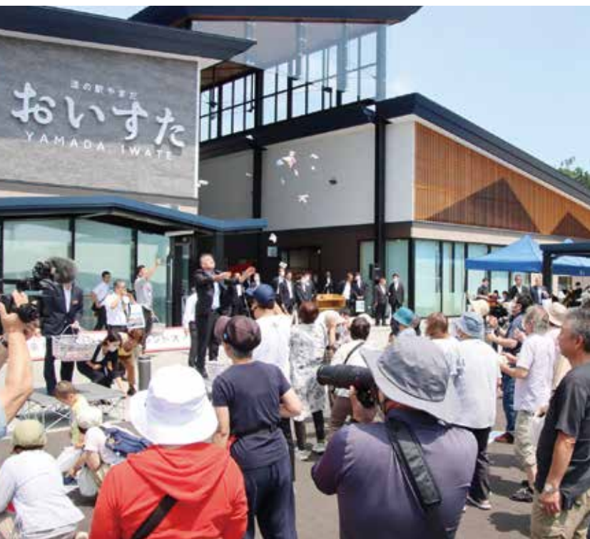
オープニングセレモニーで行われた「えびすまき」