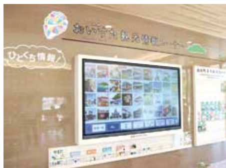
観光情報などを発信するデジタルサイネージ

休憩施設では、総合案内所や休憩スペース、24時間利用可能なトイレとバリアフリーに対応した多機能トイレが設置されています。中央には、道路情報を確認できる電子掲示板のほか、町内の観光情報を検索できるタッチパネル式モニター「デジタルサイネージ」が設置され、町内の見どころなどを紹介しています。