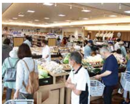
にぎわいを見せる産直売店