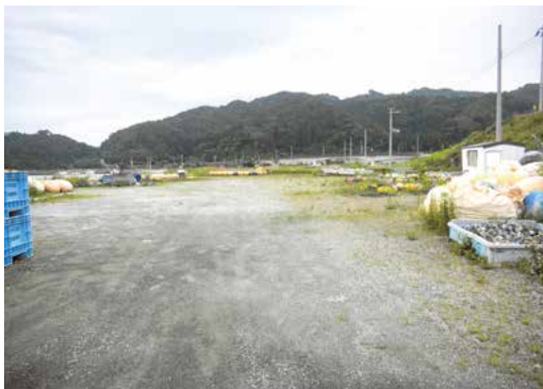
「海業」で織笠漁港を元気に