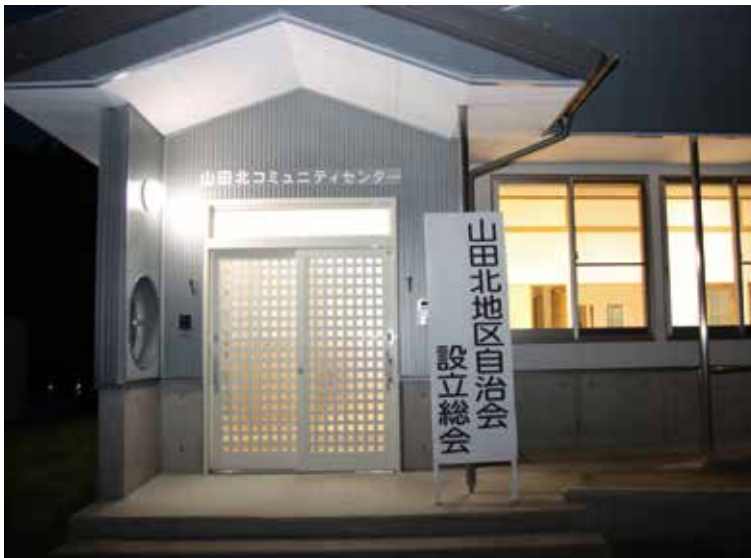
柳沢地区に自治会ができました

町長 旧山田北小学校の活用については、校庭部分は新・道の駅の機能を補完する施設として、車中泊施設やドッグラン等を整備する計画となっている。旧校舎については、改修に多大な事業費を要するとの試算結果から、引き続き検討を行い、慎重に判断する必要があると考えている。