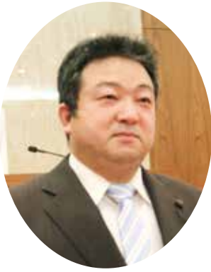
なり成 議員 かざ一 所属 さわ一 所 くろ黒 (無)