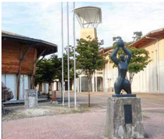
小・中学生の健全教育が望まれる山田の教育

問 令和4年度のいじめ案件はどのくらいで、どのような対応策を講じたか。同じく不登校の実態は。