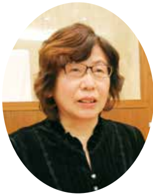
きむら ようこ 議員 木村洋子 (日本共産党)