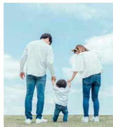
安心して医療を受けられるような制度の充実が求められます

(第3号)が可決されました。新たに新型コロナウイルス感染症対応の経済対策として、プレミアム付商品券事業費補助金や観光宿泊施設等支援事業費補助金などが盛り込まれています。