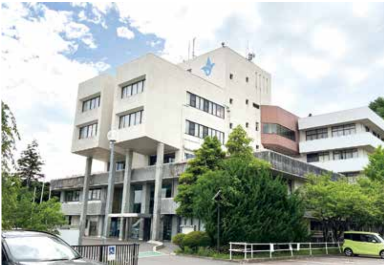
今後も適切な採用、人事配置が求められます

問 「人口に合わせて採用を抑制すべき。」「今後の財政的に大丈夫なのか。」と疑問の声がある。町民の大多数が納得できる具体的な説明が欲しい。 町長 震災復興期間中やその後の複雑専門化する業務に対し職員数が