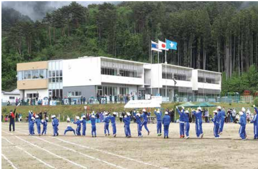
5年度末に閉校する船越小学校