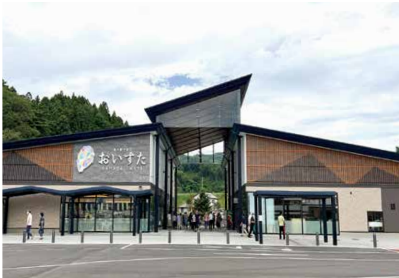
町の“活性化”と“憩いの場所”の期待が高まる 新・道の駅“おいすた”

問 新・道の駅“おいすた”が7月開業する。観光客はもちろんだが、町民にとっても楽しく憩いの場所になるのは間違いないと考えるか。 答 新・道の駅“おいすた”が7月開業する。観光客はもちろんだが、町民にとっても楽しく憩いの場所になるのは間違いなく、交通アクセスはどうかという点については、車のない高齢者にとっても利用しやすい状況になっているか。