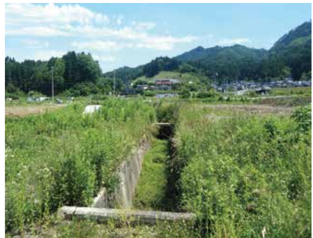
今後の処理が必要な旧女川