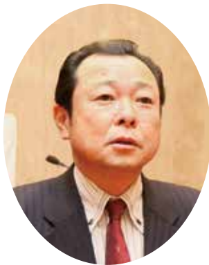
議員 山崎 泰昌 (政和会)