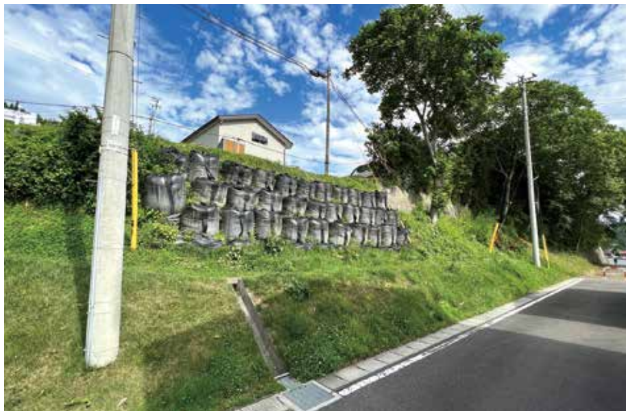
台風19号で被災した法面