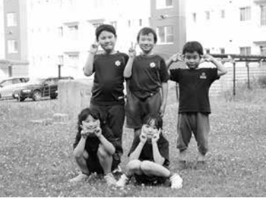
カメラに向かってピース