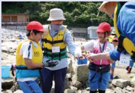
「海の生き物学習会」での学習支援の様子