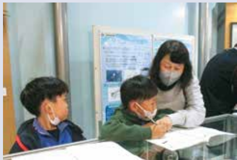
「鯨と海の科学館見学」での学習支援の様子