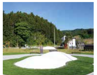
緑地広場に設置された「ふわふわドーム」

シンボルツリー(ウラジロモミ)などの樹木を植え、集客の目玉となる空気膜構造遊具「ふわふわドーム」が2台設置されています。