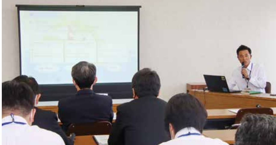
活動報告会の様子

6月8日、町の「地域おこし協力隊」の活動報告会が役場庁舎内で開かれ、町の職員ら21人が同月末で退任した隊員の活動内容や成果などの発表に耳を傾けました。「地域おこし協力隊」は、地域資源を生かしたまちづくりを推進するため、個人の持つ技術や経験を生かしてもらおうと設置しているもので、都市地域から町内に生活の拠点を移し、任期終了後も定住意欲のある人材を隊員として任命し一定期間活動してもらおう制度です。ここでは、報告会の模様などをお伝えします。