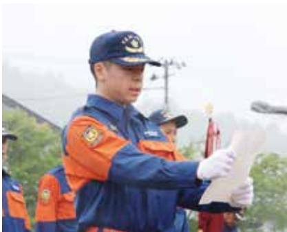
宣誓書を読み上げる中屋さん

団員の各種表彰や服装などの点検が行われた後、消防団員が消防操法（分水器使用小型ポン