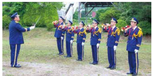
団員の士気を高めるラッパ隊