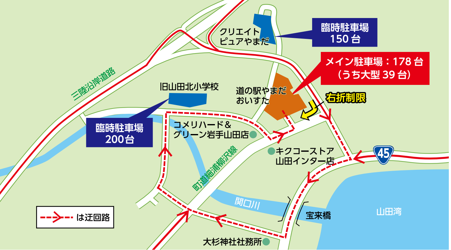
交通渋滞対策のための案内図(実施日：7月6日～30日)