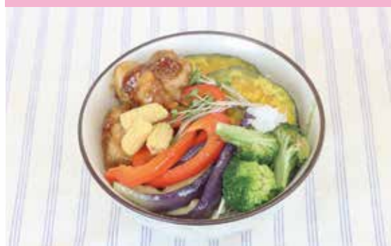
1人当たりの栄養素 646kcal、塩分2.4g 2