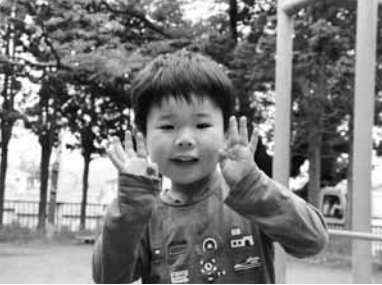
町で出会ったかわいい笑顔