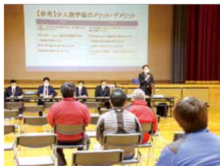
学校統合の地域説明会の様子

▼学校活動での役割を、少ない人数でやらなければならないため、一人当たりの負担が大きい ▼友人関係を築くのにも小人数では厳しいと思う。クラス替えができることへの期待は大きい ▼子どもには、多くの選択肢を与えたい。少人数では選択肢が狭まってしまふ気がする▼小学校を無くすということは地域に