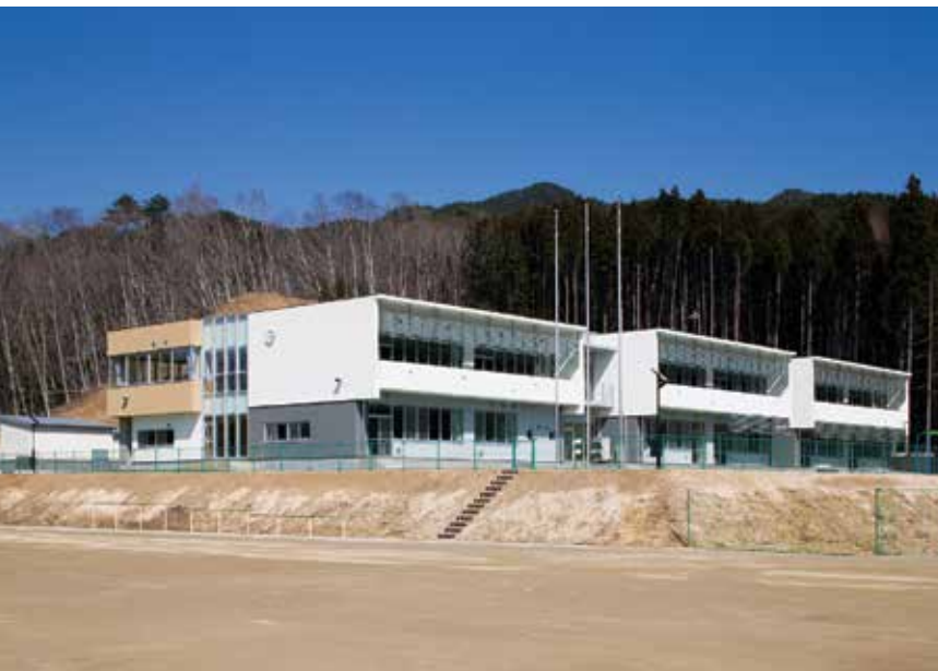
山田小学校への統合が決定した船越小学校

町では、今後、船越小の保護者や地域住民に協力を求めながら統合に向けて準備を進めます。