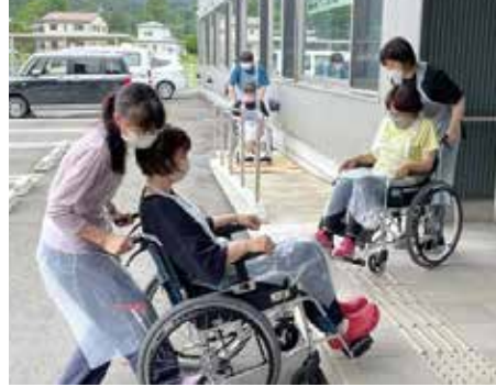
介護の知識や技術を基礎から学べます(昨年度の「入門的研修」の様子)

◆申請先・問い合わせ 町長寿福祉課高齢者福祉係 ☎82-3111内線148)へどうぞ。