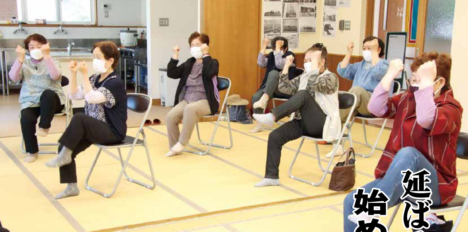
シルバーリハビリ体操教室の様子(大沢川向友の会)