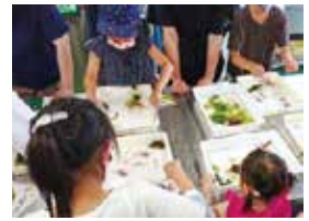
昨年度の教室の様子

鯨と海の科学館では、生の海藻から作る「海藻おしばアート教室」を開催します。どなたでも参加できますので、お気軽にお申し込みください。