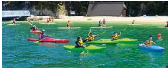
昨年度の海洋教室の様子

浮き輪やペットボトルなど、水に浮きそうなものを投げてください。できるだけ体の近くをめがけて投げましょう。