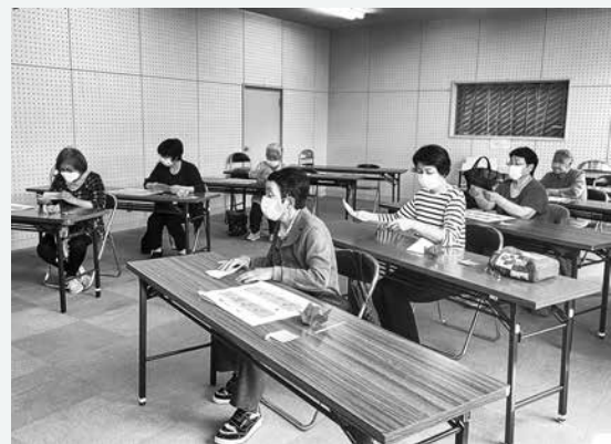
昨年の「おりがみ講座」の様子

◆申込先・問い合わせ 町教育委員会生涯学習課 社会教育係(☎82-3111内線624)へどうぞ。