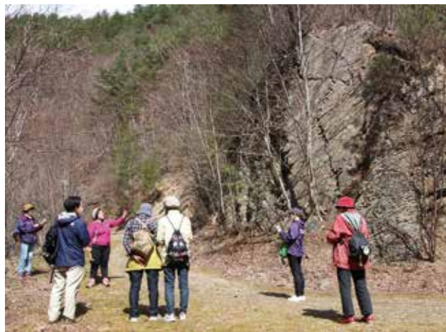
地層の歴史説明を受ける参加者 (豊間根川ジオ散歩)