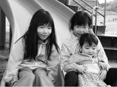
まちかどスナップ