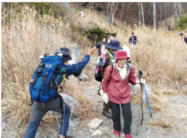
登山が終わりゴールを迎える参加者 (霞露ヶ岳ジオトレッキング)