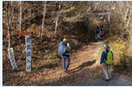
霞露ヶ岳登山口は看板があり、安心して入山できます