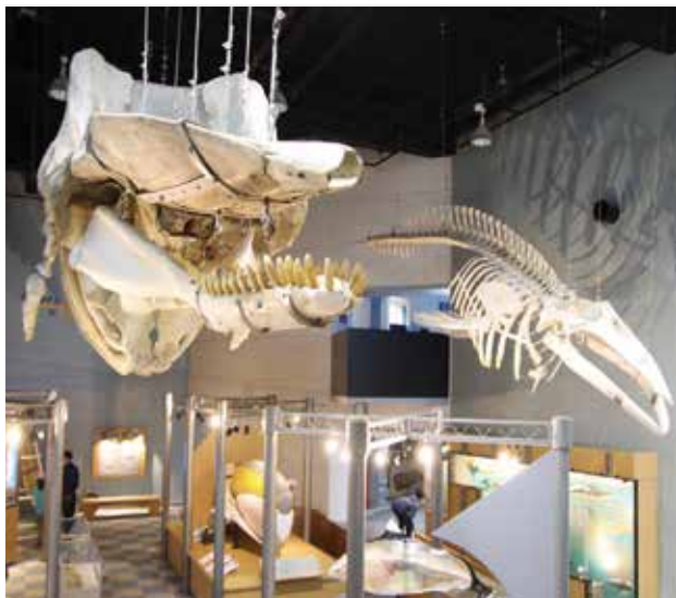
普段見られない映像やパネル展示などでクジラ不思議に迫ります

▽期間 5月20日(土) ~ 7月2日(日) ▽時間 午前9時~午後5時 ▽会場 鯨と海の科学館 1階特別展示室 ▽入場料 大人300円、高・大学生200円、小・中学生150円 ※幼児は無料となります。 ◆問い合わせ 鯨と海の科学館(☎84-3985)へどうぞ。