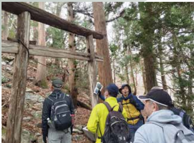
歴史・文化の説明を受ける参加者 (霞露ヶ岳ジオトレッキング)