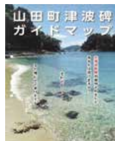
作製した「山田町津波碑ガイドマップ」

時間を載せ、足を運びやすくする工夫を施しているほか、外面には、東日本大震災以前の地震津波の被害規模をまとめています。製作した部数は5千部で、マップは町内の公共施設で入手することができ、希望する人は直接施設にお申し出ください。