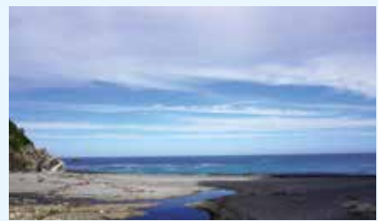
漣磯海岸は海の迫力を体験できるスポットになっています