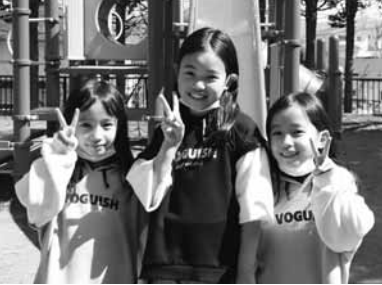
カメラに向かってピース