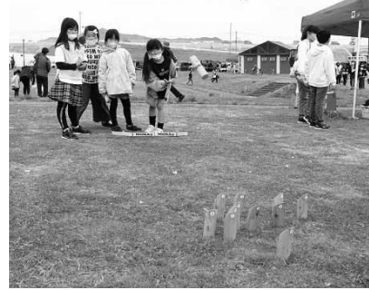
モルックを体験する子どもたち(今年のむらまつりの様子)

宮古警察署や山田消防署、陸上自衛隊山田分屯基地で実際に使用されている車両を展示します