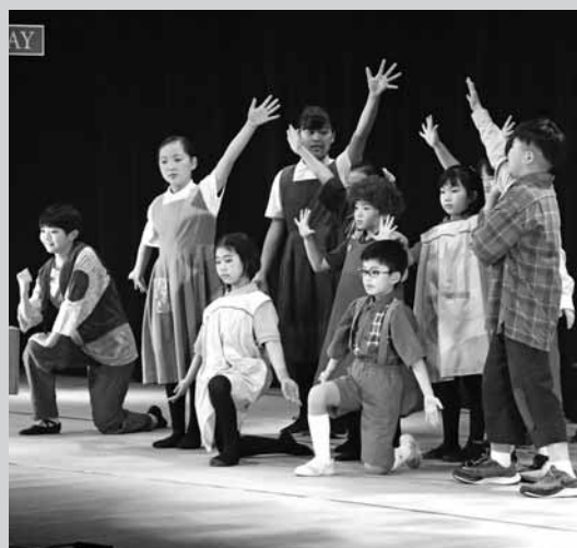
昨年のキッズミュージカル「小さな孤児ANNIE」の様子

整理券配布所 町中央公民館、町ふれあいセンター、役場船越支所・豊間根支所 ※今月14日(水)から配布します