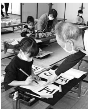
今年開かれた大会の様子