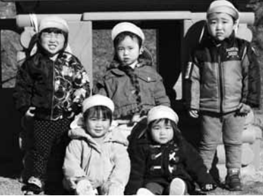
町で出会ったかわいい笑顔