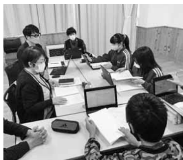
発表会に向けた準備に取り組む船越小6年生の児童たち

船越小学校では、町の出前講座やフィロドワークなどで防災学習に取り組んできた同校6年生による学習成果発表会を行います。テーマは「これからの防災く誰ひとり命を失わないために」です。児童たちが「防災無線」