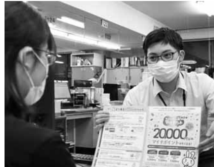
申請手続きは町職員がサポート

◆問い合わせ ▶町道の除雪など…町建設課土木管理係 (内線233) ▶国道の除雪など…三陸国道事務所宮古西維持出張所(☎71-1760) ▶県道の除雪など…宮古土木センター道路環境チーム(☎64-2221)へ。