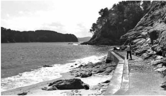
みちのく潮風トレイルのコースにもなっている寄り浜。みんなで海岸をきれいにしませんか