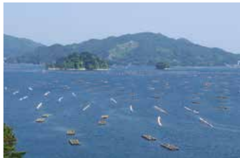
町の豊かな海を守るため、プラスチックごみを減らそう

共下水道整備事業の推進など ■ 地域・個人で実践できること ・プラスチックごみを削減、リサイクルする ・海や浜辺の清掃活動に参加する