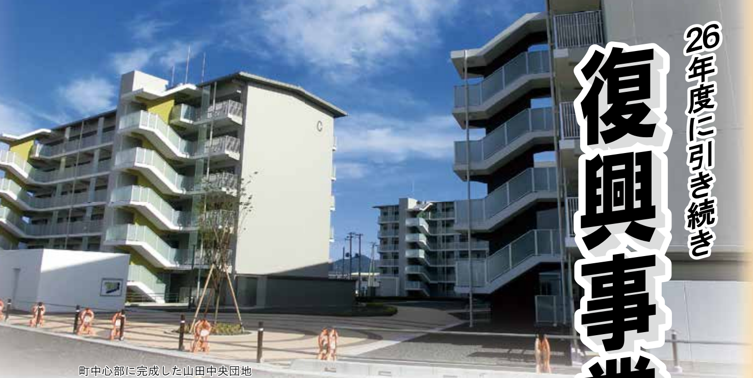
町中心部に完成した山田中央団地