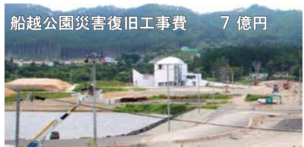
船越公園災害復旧工事費 7億円

川守田建設課長 基本的には原形復旧だが、ことしの夏ごろに災害査定を受け、その結果を見ながら検討していく。 問 復旧完了時期はいつごろになるか。 建設課長 29年3月頃を予定している。