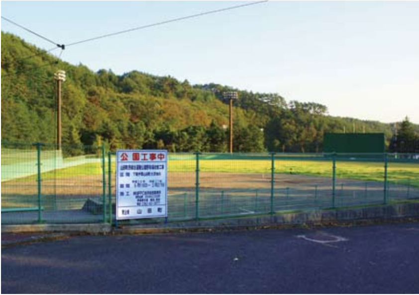
改修工事中の町民総合運動公園野球場

平成28年に開催される希望郷いわて国体で高校軟式野球競技の会場となる町民総合運動公園野球場の工事を行います。施設の劣化を解消し、選手の安全を確保します。(質疑なしで可決)