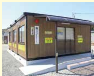
民間交番維持は補助金で

町民課 町からは、民間交番の運営主体となる防犯協会に対し、補助金という形で支援していく。