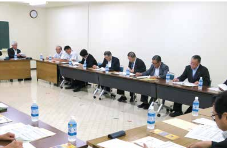
庄内町議会の先進的な取り組みを学びました

定例会の日程や一般質問の内容を記載した案内を作成し、各地区で回覧してもらっています。