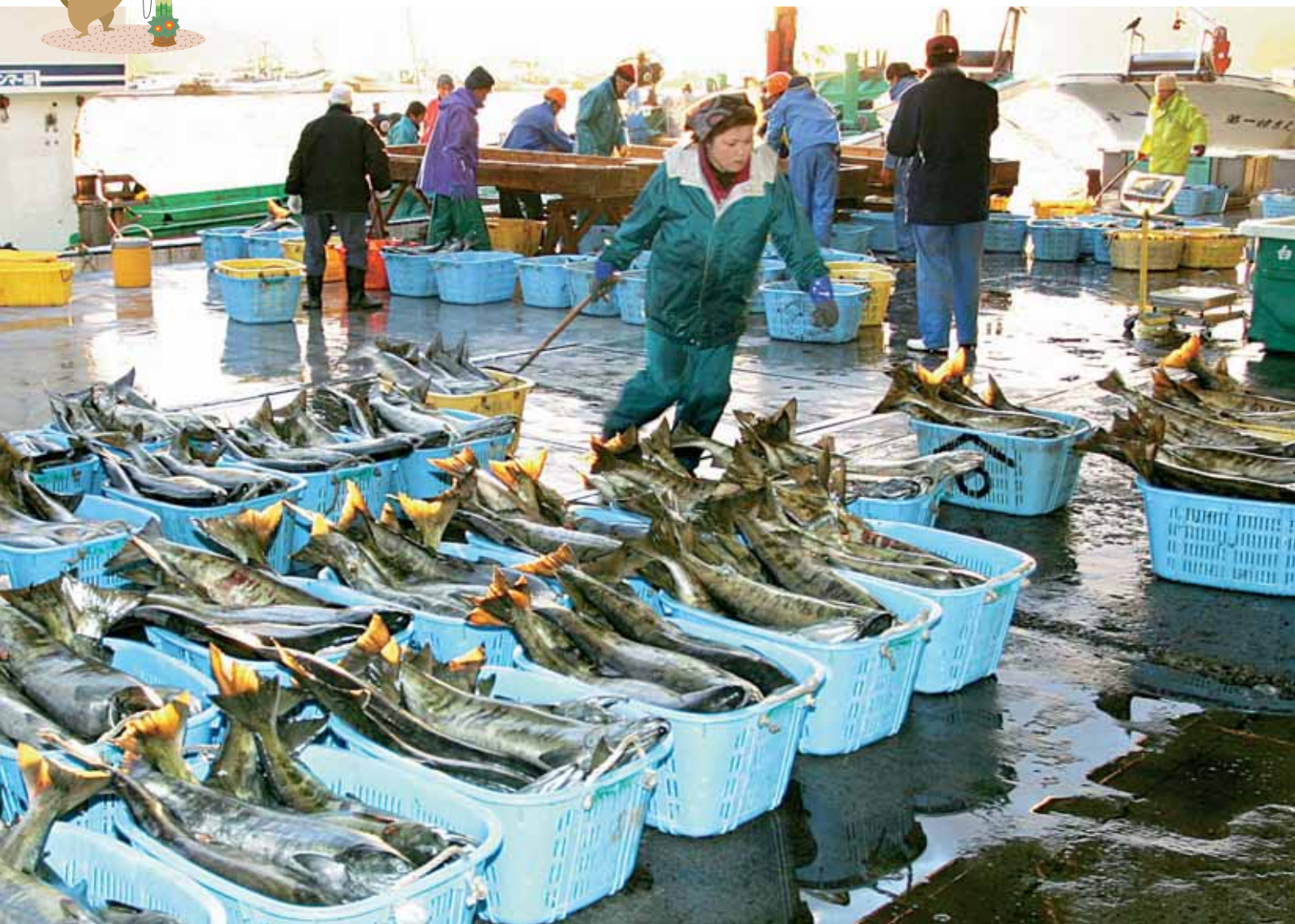
平成20年1月4日の初水揚げの様子（山田魚市場）