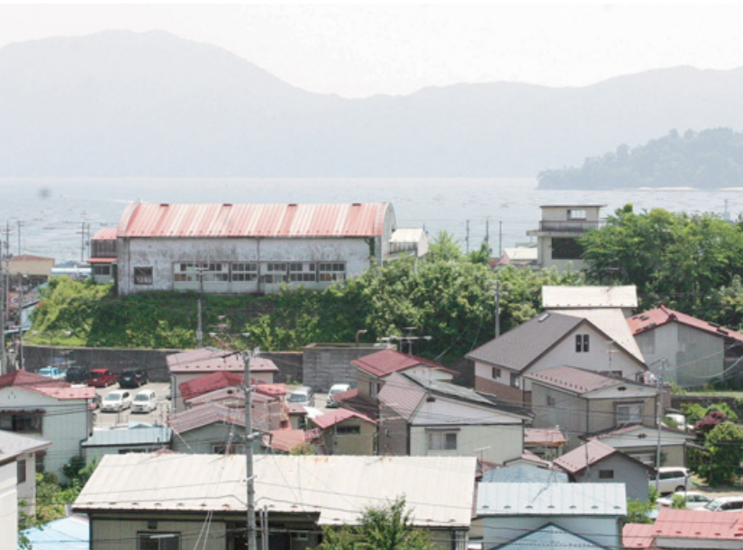
旧公民館などを解体し、多目的広場として整備されます（役場からみた「おぐら山」の風景）