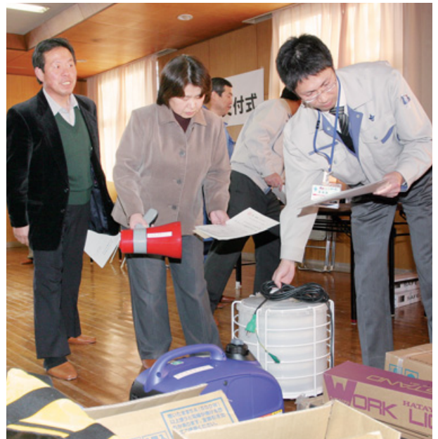
防災機材交付式で職員から機材の説明を受ける自治会の皆さん(本年2月の様子)