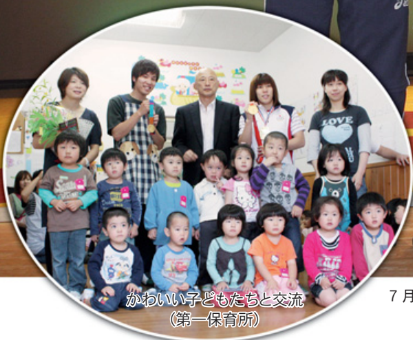
かわいい子どもたちと交流 （第一保育所）