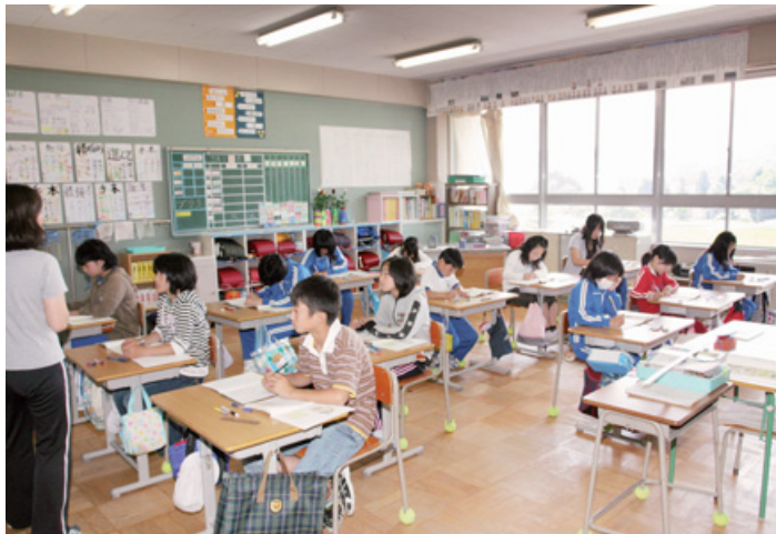
複式学級での授業風景 (荒川小学校5、6年生)