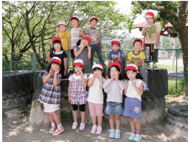
町の次世代を担う子どもたちが安心して医療を受けられる地域医療の確立が望まれます(かわいい笑顔の園児たち：さくら幼稚園)