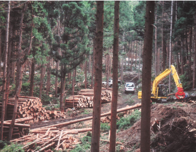
町有林の間伐作業の様子