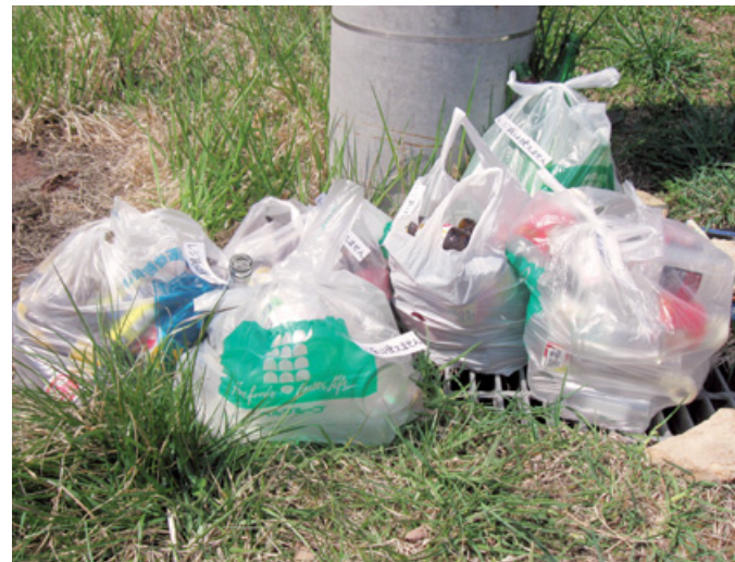
指定された袋以外でゴミを出したため、回収されなかったゴミ（回収できない理由を記載したメモが貼り付けられています）

があったと聞かすが、それらを未然に回避するため、回収業者に対して、回収時の対応の仕方を指導しては。 沼崎町長 住民より苦情があった際には、電話などで