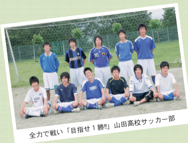
全力で戦い「目指せ1勝!!」山田高校サッカー部

山田にはおいしい魚介類や赤ちゃんから大人まで楽しめる「秋祭り」などがあります。もっと山田の特色を生かし、観光客が訪れる町になってほしいです。そのためにも自分自身、もっと山田の良いところを知り、アピールできるようになり、町外の皆さんに山田の魅力を積極的に伝えていきたいと思っています。 —目標(夢)は 大会では、一戦一戦最後まであきらめずに全力で戦い抜くことです。そのためにも、毎日の練習を大切にしながら、後輩たちに「何か」を残