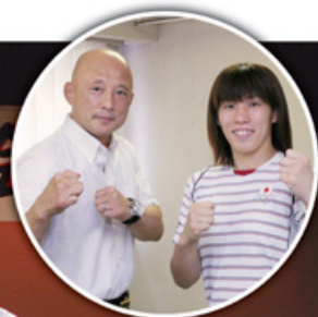
笑顔のふたり （楽屋にて）