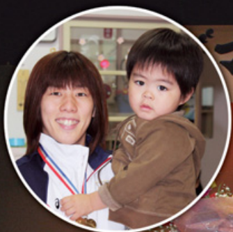
この笑顔を見ると「目指せママでも金」と言いたくなる？ （第一保育所でのコマ）