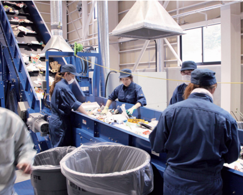
家庭での分別がさらに徹底されれば、分別作業のコスト削減になります（第2リサイクルセンター：宮古地区広域行政組合）