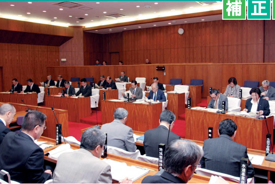
第2回定例会の様子