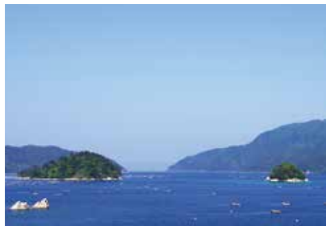
オランダ島・小島が第1種特別地域に

平成30年3月27日に山田湾の一部の海域（左図参照）が国立公園内海域公園地区に指定されました。さらに、オランダ島、小島は国立公園第2種特別地域から第1種特別地域に格上げ。これは、リアス海岸の湾部にある山田湾、オランダ島と小島の優れた（美しい）内湾景観が評価されたものであり、この優れた海域景観の維持及び適正な利用を図る目的で指定されたものです。