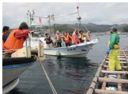
観光振興・産業振興に生かしていきます (マリンツーリズムの様子)

とで、開発行為などから山田湾とオランダ島の美しい内湾景観を保護することが可能です。なお、これまで行われてきた漁業や船舶の航行、マリンスノーなどの活動が制限されることはありません。