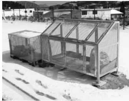
ごみ集積箱を利用してきれいな町に

町では、ステーション用のごみ集積箱を共同購入する際、費用の一部を補助しています。新たにステーションの設置を計画している場合やごみ集積箱の増設を検討している場合は、事前にご相談ください。