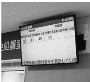
導入された待ち時間システム

岩手県立山田病院では、院内での待ち時間短縮や院内感染防止対策のため、「待ち時間システム」を導入しました。