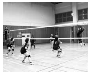
昨年の大会の様子

◆申込先・問い合わせ 町生涯学習課社会体育係(☎82-3111内線682)へどうぞ。