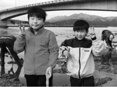
カメラに向かってピース