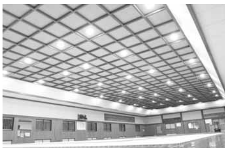
LED灯に更新した町立武徳殿