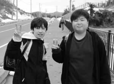
カメラに向かってピース