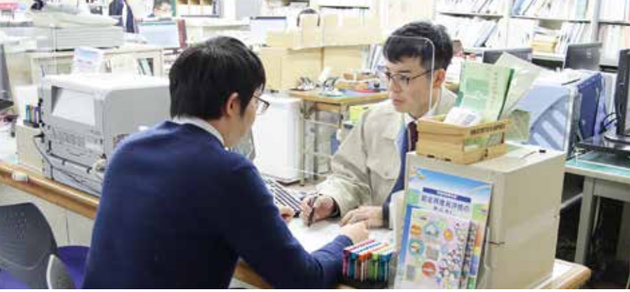
税務窓口で対応する役場職員