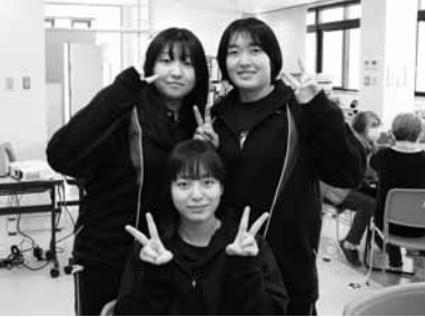
カメラに向かってピース