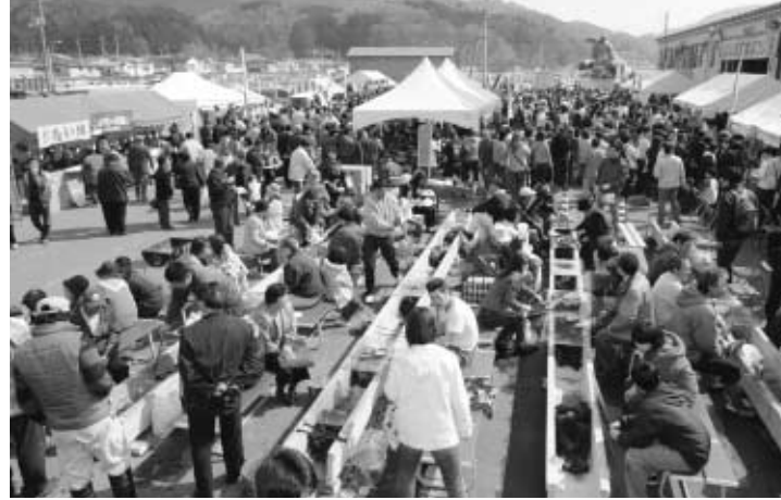
3月19日に開催された「三陸山田カキまつり」町内外から12,200人もが行楽客が訪れ、旬の味覚カキを味わっていました