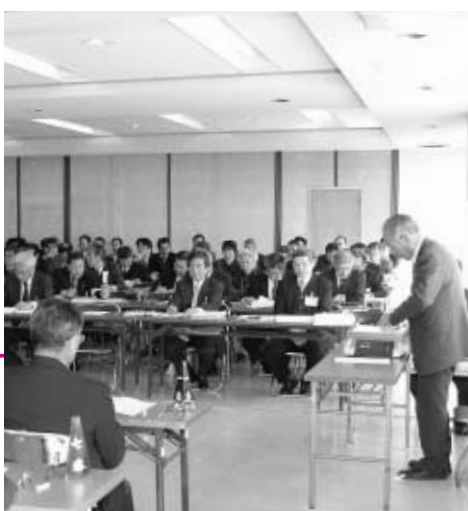
4日間に及んだ予算特別委員会新年度予算について活発な議論が交わされました

町長 新たな組織を立ち上げ、山田魚市場の振興策に取り組み。春カキに力を入れてはと提言もしている。町長 「産・学・官の審議会」を設置して、産業政策を検討し、生産者に政策誘導を図るべきでは。